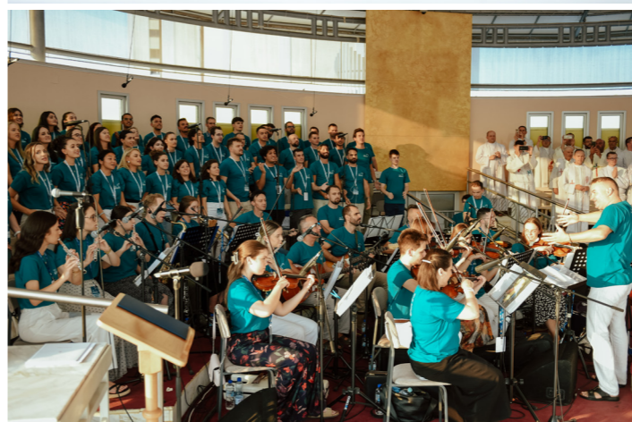
35. Mladifest u Međugorju