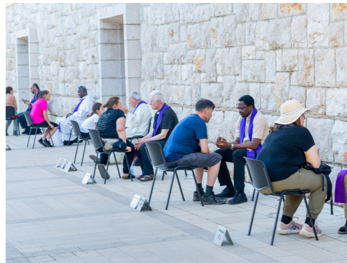
Devetnica sv. Jakovu, zaštitniku naše Župe