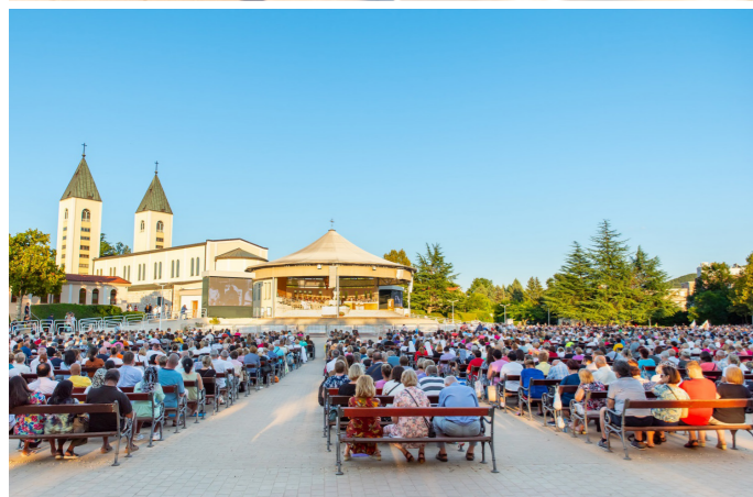
Proslavljen blagdan rođenja BDM - male Gospe