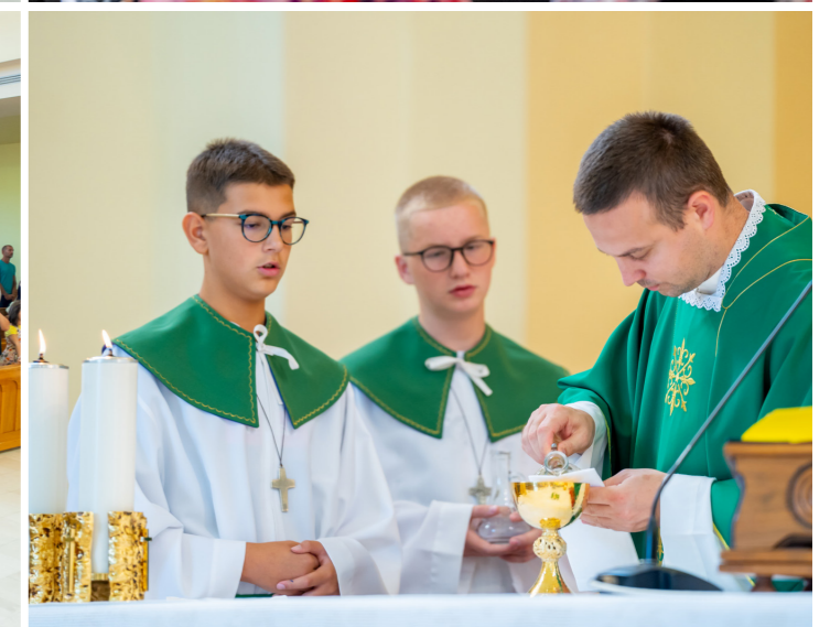
U našoj župi započeli susreti biblijske grupe za župljane / Sveta Misa za početak nove školske godine