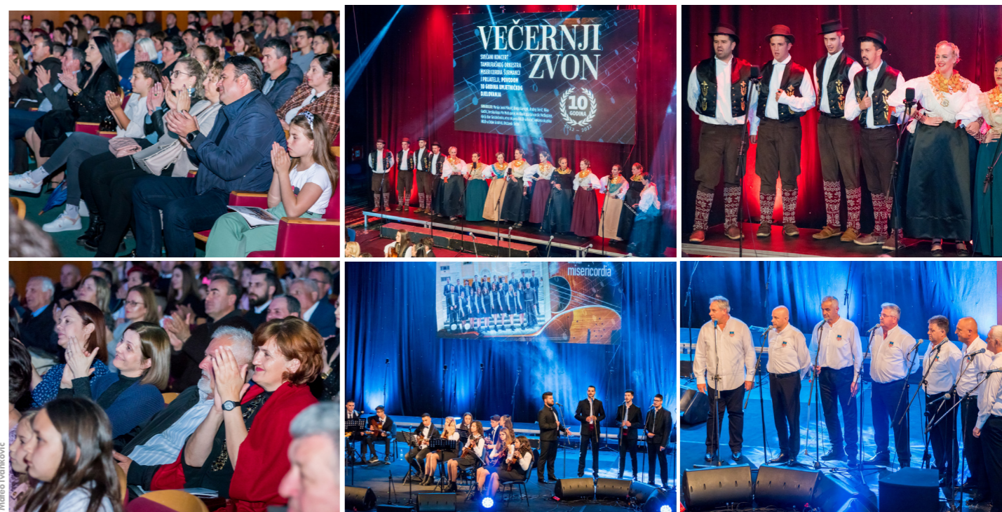
Svečani koncert "Večernji zvon" tamburaškog orkestra "Misericordia" iz Šurmanaca, povodom 10 godina umjetničkog djelovanja