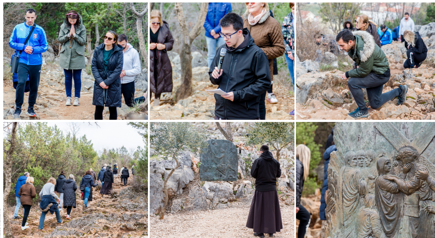
Molitva križnoga puta na Križevcu

Isus, koji je u Galileji već bio «slavljen od sviju» (Lk 4,15), našao se i među svojim u Nazaretu, i to u subotu u sinagogi. U prvom trenutku činilo se da će i tu biti prihvaćen i „slavljen od sviju“, ali najednom neočekivan i teško protumačiv obrat. Dok su se neki njegovi sugrađani još «divili milini riječi koje su tekle iz njegovih usta», većinu je obuzeo osjećaj tipičan za svaku malu sredinu koja ne dopušta da se netko iz te sredine izdigne iznad drugih i zato njihova reakcija: «Nije li ovo sin Josipov?» (4,22). U malom Nazaretu svi znaju da je Josip tesar i da je Isus kao dječak sam učio taj zanat, a sad najednom se u sinagogi želi nametnuti kao učitelj.