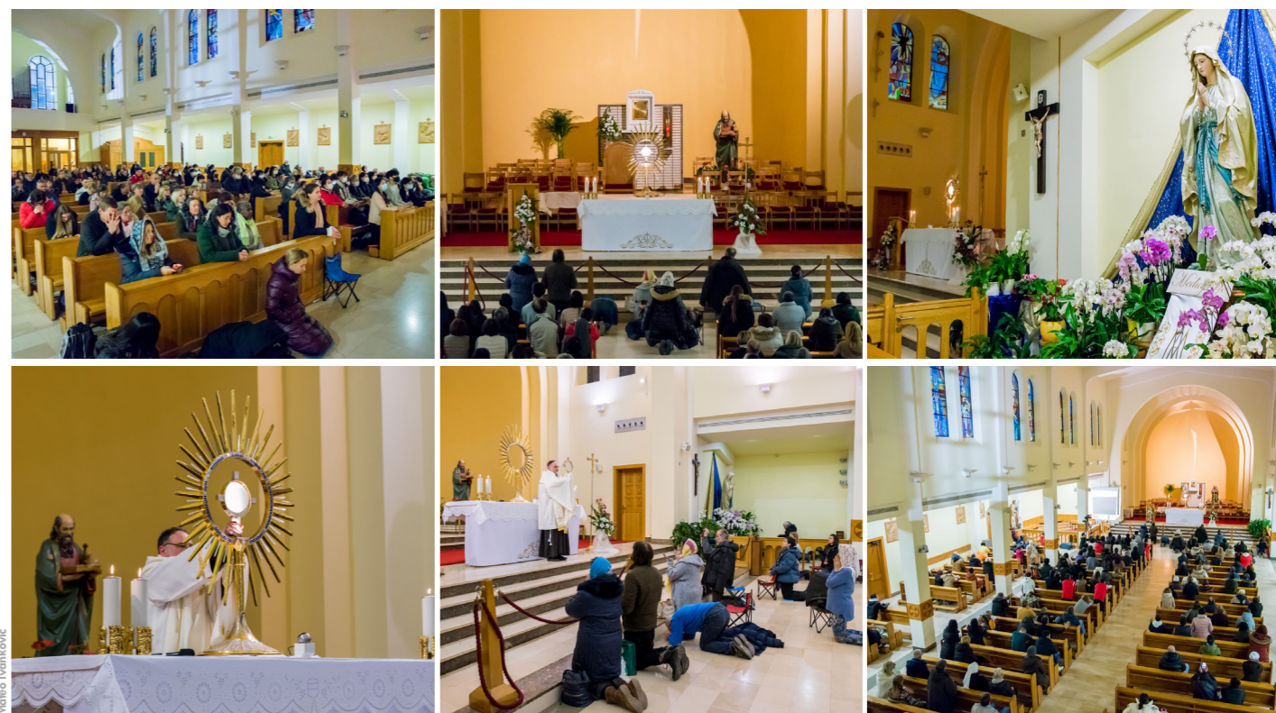
Cjelonoćno klanjanje Isusu u Presvetom Oltarskom Sakramentu

NB! Obilazeći stare i bolesne primijetio sam već požutjele plastificirane OSMRTNICE na vratima obiteljskih kuća. Iako je član obitelji umro prije nekoliko mjeseci pa i godina, OSMRTNICA je na vratima. Na pitanje, zašto još uvijek OSMRTNICA na vratima, ako je pogreb davno obavljen? Odgovor je kod većine: takav je običaj da se čuva godinu dana ili toliko i toliko mjeseci. S oltara se nikada nije tako nešto čulo. Čak se nije nikada čulo da se mora slaviti sveta misa na godišnjicu smrti. Ljudi, koji su svjesni duhovnih plodova svete mise, slave godišnje svetu misu za svoje pokojne, a OSMRTNICU odmah nakon sprovoda, uklone. Neka to postane običaj! Pogrebno društvo ne može uvoditi običaje koji nisu kršćanski (bacanje ruža u grob, trub, pjevanje pjesme koja ne odgovara kao npr. Krist na žalju, plastificirane osmrtnice...).